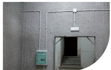
LA POSTE - CATANIA - ITALIE