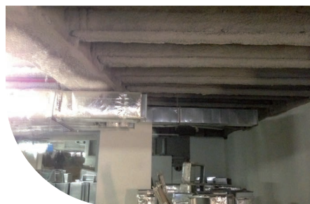
ENPAM - ROME - ITALIE