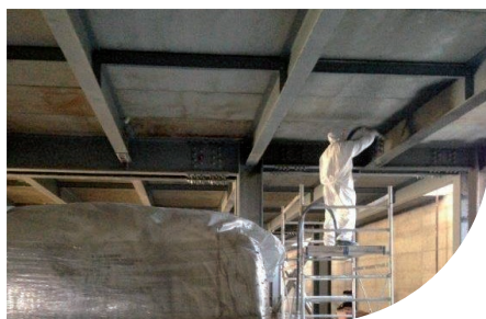
AÉROPORT - BARI - ITALIE