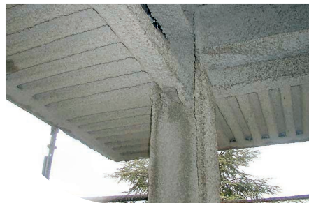
HÔPITAL - GRAVEDONA (CO) - ITALIE