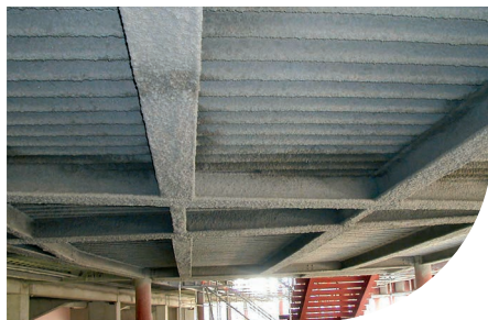
CINEMA MULTIPLEX - TORINO - ITALIE