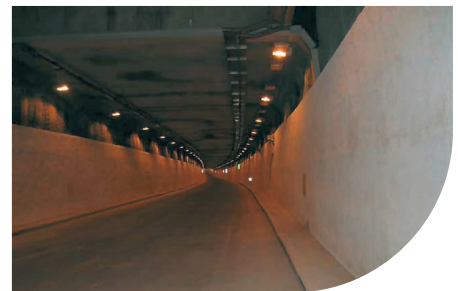
"CIRCONVALLAZIONE NORD" REVÊTEMENT DE LA GALERIE - ROME - ITALIE